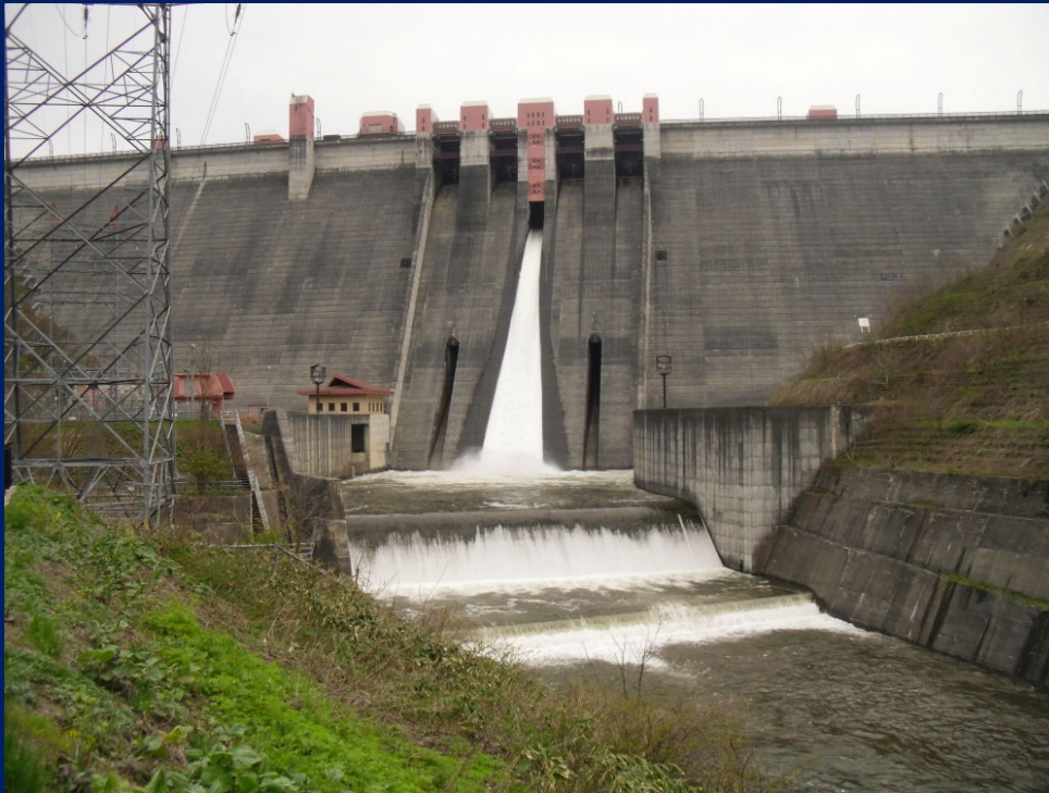
浅瀬石川ダム『オリフィスゲートからの放流』 (令和2年5月3日撮影)