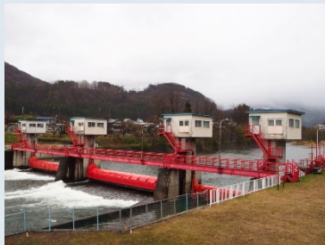
▲田植え本番を待ち構えているような温湯頭首工