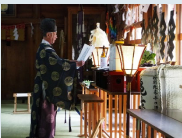
▲祝詞には新型コロナウイルス感染症の早期終息の願いも含まれた