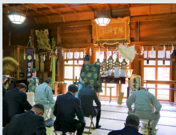
▲座席の間隔を空け行われた水入祭