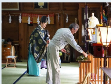
▲関係者らによって行われた玉串奉奠